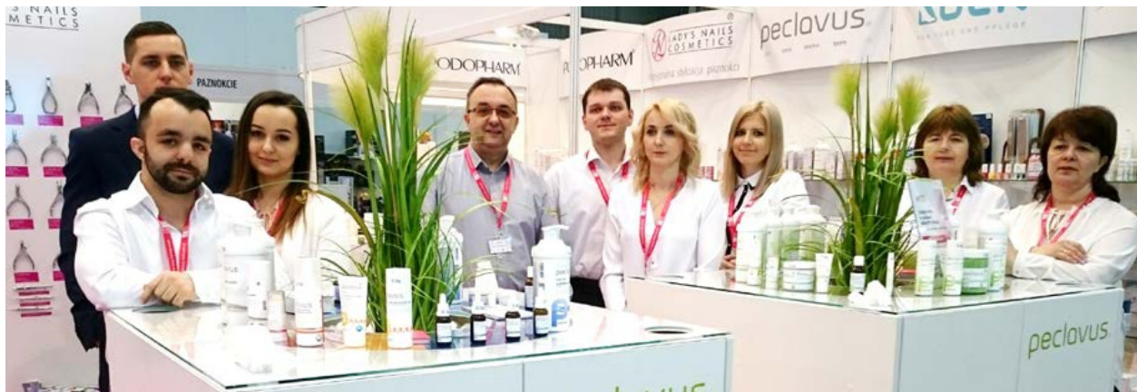
Das Messe-Team unseres polnischen Partners auf der BEAUTY FORUM Warschau 2017

Die Zusammenarbeit im internationalen Bereich hat sich im letzten Jahr für RUCK sehr positiv entwickelt. Ein Highlight war die Messe BEAUTY FORUM am 11./12. März 2017 in Warschau, Polen. Unser Partner "Lady´s Nail Cosmetics" war dabei und das International Sales Team von RUCK war begeistert von der professionellen Präsentation der RUCK Produkte. 223 Aussteller für die Bereiche Kosmetik, Nail, Fuß, Naturkosmetik, Wellness & Spa und Medical Beauty waren vertreten und mit über 16.000 Fachbesuchern war die Messe ein großer Erfolg.